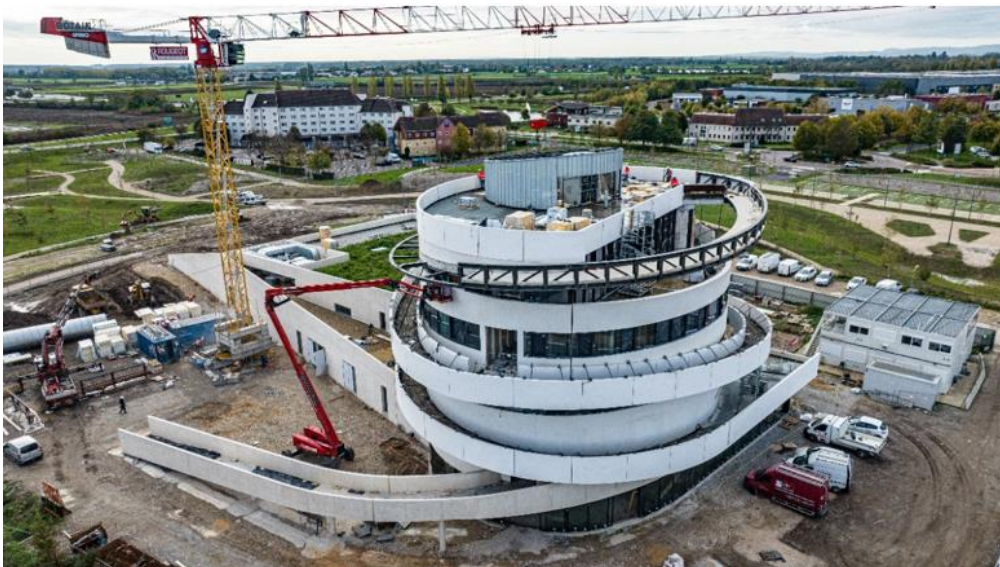
La Cité à Beaune en novembre 2022

Une visite inaugurale du bâtiment à Beaune s'est déroulée mardi 22 novembre auprès des partenaires et co-financeurs. Organisée par la Ville de Beaune , maître d'ouvrage, cette visite marque l'avancée de ce bâtiment écoresponsable à la technicité architecturale spectaculaire qui s'intègre dans un tout nouveau quartier et au sein du parc « La Chartreuse » de 10 hectares. Des voies douces seront mises en place pour relier ce nouveau quartier au centre-ville : parking relais et de co-voiturage, voie piétonnière le long de la Bouzaise, navettes électriques, piste cyclable et bornes de recharges pour vélos électriques.