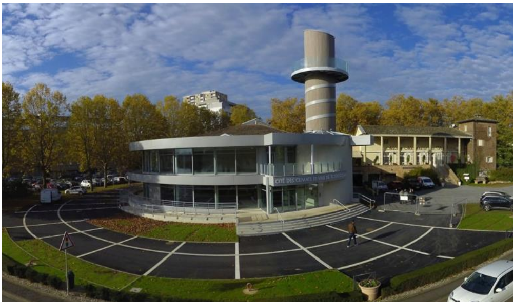
La Cité à Mâcon en novembre 2022