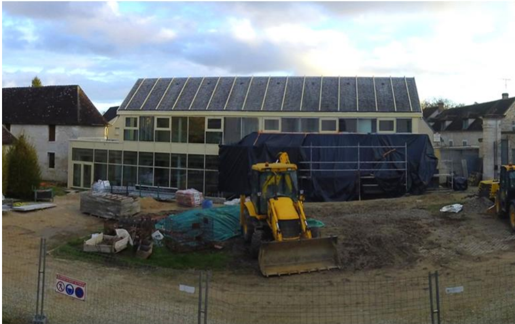
La Cité à Chablis en novembre 2022

Suivez l'évolution de la Cité des Climats et vins de Bourgogne sur www.cite-vins-bourgogne.fr